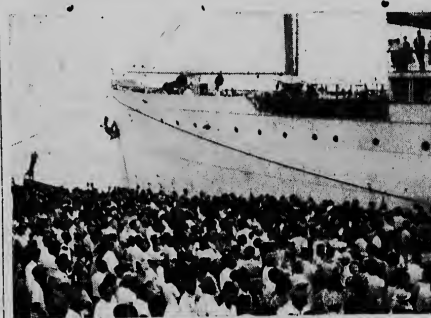
Hier ziet men de grote drukte op de kade.

De taxi's waren in vol bedrijf om zo ineens de 230 passagiers af te werken, daar kwam dan nog bij, dat het publiek ook huiswaarts keerde — althans gedeeltelijk — zodat er in no-time een aanzienlijke opstopping op het haven terrein te zien was. Gelukkig greep de politie ook hier snel en met bekwame hand in, zodat het op-